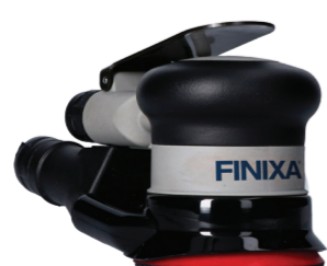
MINI SCHUURMACHINE MET CENTRALE STOFAFZUIGING