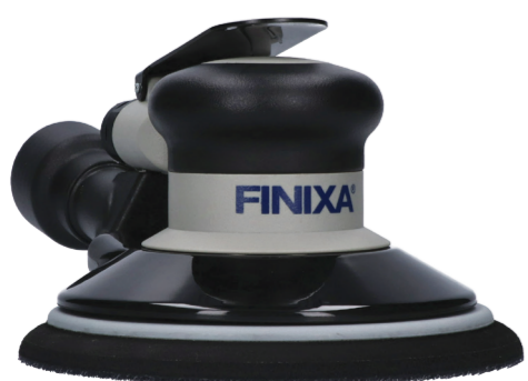
PREMIUM PNEUMATISCHE EXCENTRISCHE SCHUURMACHINE