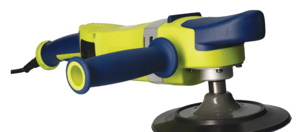
ELEKTRISCHE POLIJSTMACHINE VOOR ZWARE TOEPASSINGEN